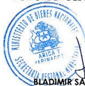
BLADIMIR SALDAÑA ARANEDA SECRETARIO REGIONAL MINISTERIAL DE BIENES NACIONALES REGIÓN DE ARICA Y PARINACOTA